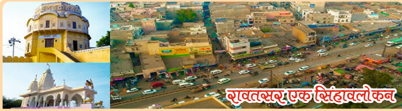
रावतसर एक सिंहावलोकन

भारत के सबसे बड़े प्रदेश राजस्थान के धान के कटोरे व शस्यश्यामला भूमि हनुमानगढ़ की सात तहसीलों में से एक बाबा क्षेत्रपाल की धार्मिक नगरी रावतसर है। इंदिरा गांधी नहर के पास बसे इस शहर की स्थापना राव राधोदास ने 1584 में विजय के माध्यम से की।