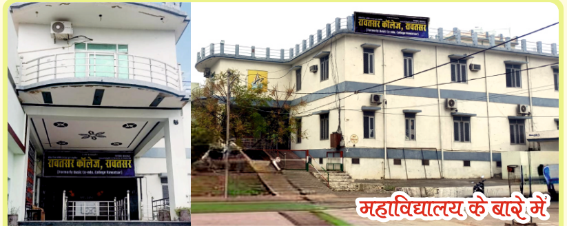
महाविद्यालय के बारे में